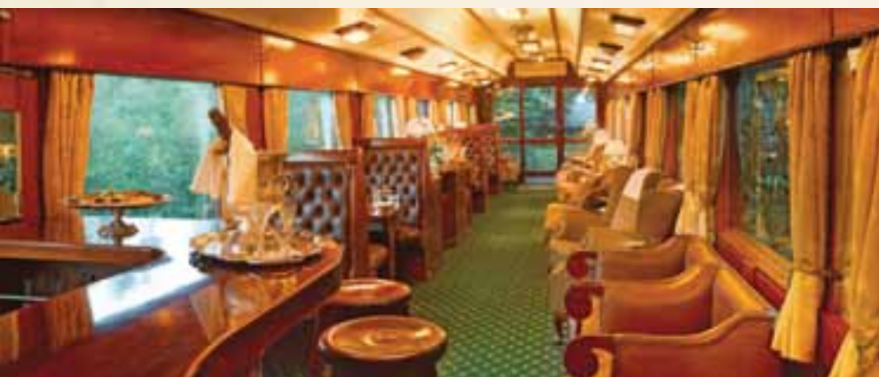
Panoramawagen mit Bar

10. Tag Auf Pirsch im Chobe-Nationalpark oder Victoria Falls Hotel Bei einer weiteren Bootsfahrt erleben Sie, wie die Tierwelt im wildreichen Chobe-Nationalpark erwacht. Genießen Sie anschließend beim Frühstück die Aussicht von der Lodge-Terrasse, bevor Sie per Bus zurück nach Victoria Falls fahren. Falls Sie im Victoria Falls Hotel übernachten haben, steht Ihnen der Vormittag zur freien Verfügung. Ein Rundflug mit dem Helikopter über die beeindruckenden Viktoriafälle ist sicherlich ein Höhepunkt (vor Ort buchbar). Mit traditionellen Tänzen der Shangaan wird Ihr Zug am Nachmittag aus dem Bahnhof von Victoria Falls verabschiedet. (FMA)