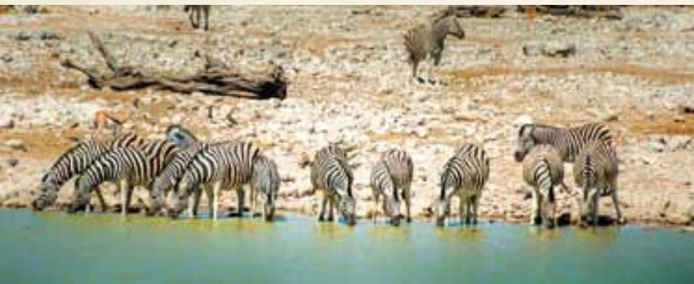
Wasserlöcher bieten beste Voraussetzungen zur Tierbeobachtung

11. Tag Auf Pirsch im Chobe-Nationalpark oder Victoria Falls Hotel Bei einer Bootsfahrt erleben Sie, wie die Tierwelt im wildreichen Chobe-Nationalpark erwacht. Genießen Sie anschließend beim Frühstück die Aussicht von der Lodge-Terrasse, bevor Sie per Bus zurück nach Victoria Falls fahren. Falls Sie im Victoria Falls Hotel übernachtet haben, steht Ihnen der Vormittag