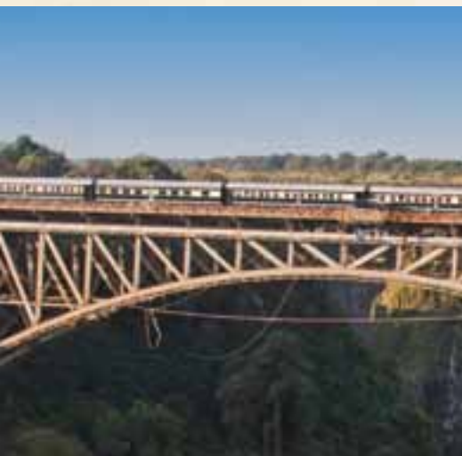
Fotostopp auf der Victoria Falls-Brücke

18. und 19. Tag Abschied von Afrika Der Vormittag steht Ihnen für eigene Stadterkundungen und Souvenirkäufe zur Verfügung. Bei gutem Wetter sollten Sie sich die Auffahrt auf den Tafelberg per Seilbahn nicht entgehen lassen (Transfer wird auf Wunsch arrangiert). Mittags fahren Sie zum Flughafen, wo sich Ihre Reiseleitung von Ihnen verabschiedet. Von hier fliegen Sie über Johannesburg nach Deutschland. (F)