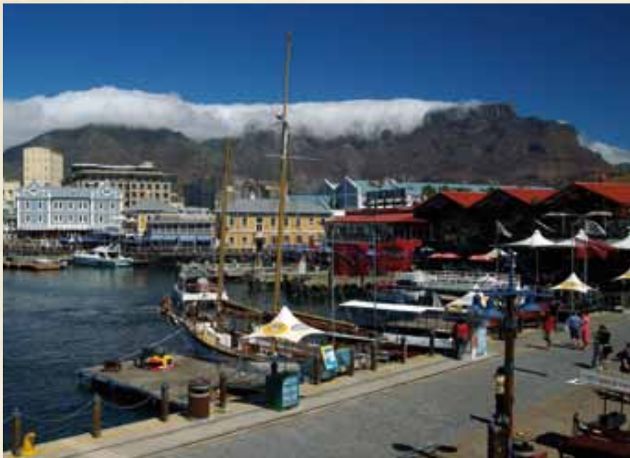
Victoria & Alfred Waterfront in Kapstadt, im Hintergrund der Tafelberg