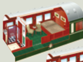
Bett: 160 cm x 190 cm

Deutlich mehr Platz zum Schlafen, Verweilen und Einladen von Mitreisenden bieten die komfortablen Suiten der Kategorie Deluxe. Ein Waggon beherbergt nur 3 Suiten, sodass maximal 6 Gäste in einem Waggon residieren. Die 22 geräumigen Suiten der Kategorie Deluxe sind ausgestattet mit einem Doppelbett von 190 cm Länge und einer Breite von 160 cm (rechtwinklig zum Fenster) bzw. 190 cm (parallel zum Fenster) oder zwei ebenerdigen Einzelbetten (über Eck) von 190 cm Länge und 90 cm Breite. Dazu stehen Ihnen zwei bequeme Stühle und ein Schreibtisch zur Verfügung.