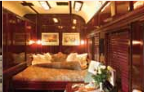
Suite der Kategorie Deluxe (Bett: 190 x 190 cm)