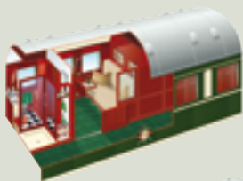
Suite mit Sofa (tagsüber)

Eine Suite der Kategorie Pullman bietet wahlweise ein Doppelbett von 190 cm Länge und 150 cm Breite oder übereinander angeordnete Einzelbetten von 190 cm Länge und 90 cm Breite (unteres Bett) und 60 cm (oberes Bett). Ein Waggon dieser Kategorie besteht aus 5 Suiten, in denen maximal 10 Gäste logieren. Die Betten werden am Tage zu einem bequemen Sofa hergerichtet.