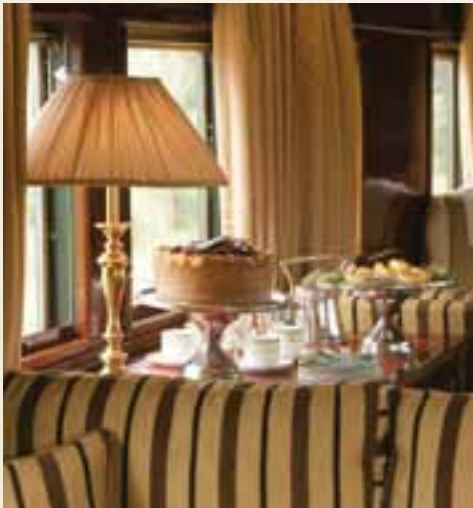
Teatime im Salon-Wagen