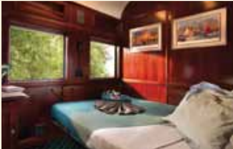
Suite der Kategorie Pullman am Abend