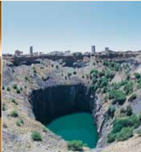
Das Big Hole in Kimberley