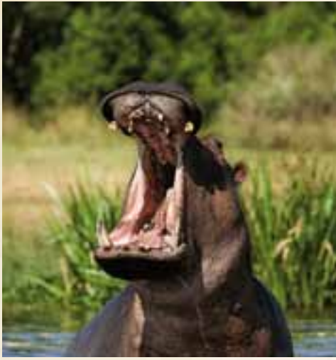
Flusspferd im Chobe-Fluss