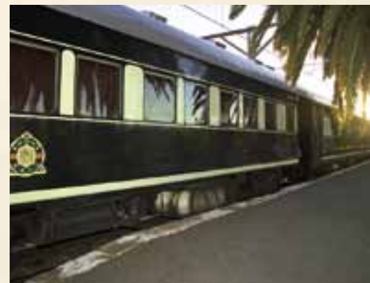
Am Bahnhof von Matjiesfontein

7. Tag Auf Safari Ein ganzer Tag steht Ihnen für die Wildbeobachtung zur Verfügung. Ihr erfahrener Ranger vermittelt Ihnen viel von seinem Wissen über die Gewohnheiten der Wildtiere, deren Spuren Sie durch den Busch folgen. Mit etwas