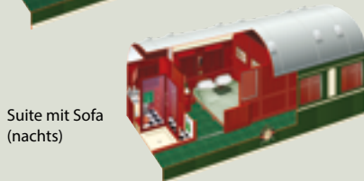
Suite mit Sofa (nachts)