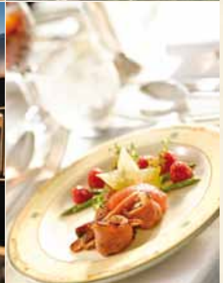
Exquisite Menüs im Restaurantwagen