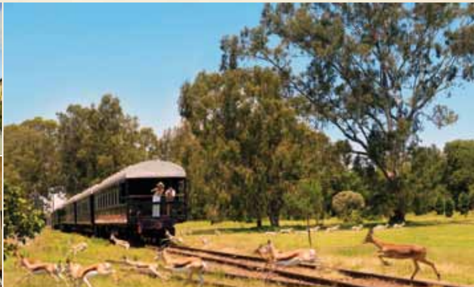
Rovos-Bahnhof in Pretoria

Glück sehen Sie Löwen, Elefanten, Nashörner, Wildhunde und vielleicht sogar den seltenen Leopard. Berühmt wurde Madikwe durch die Operation Phoenix im Jahr 1993. Im Rahmen dieser weltgrößten Wiederansiedlung von Wildtieren erhielten nahezu 8.000 Tiere in Madikwe eine neue Heimat und gaben der Region damit ihren ursprünglichen Tierreichtum zurück. (FMA)